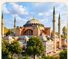
HAGIA SOPHIA โบสถ์เซนต์โซเฟีย