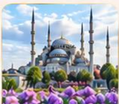
BLUE MOSQUE สุเหร่าสีน้ำเงิน