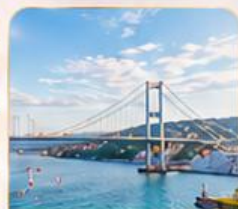
BOSPHORUS STRAIT ช่องแคบบอสฟอรัส