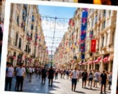
ISTIKLAL STREET (Grand Avenue of Pera) ถนนสายช้อปปิ้ง ยืน 88 ตรกม.ในทีเดียว