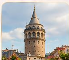
GALATA TOWER หอคอยกาลาตา