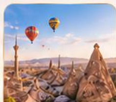
CAPPADOCIA คัปปาโดเกีย