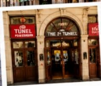
สถานีอุโมงค์ (TUNEL STATION) สถานีรถไฟใต้ดินสายเก่าแก่และเป็นหนึ่งในระบบขนส่งที่เก่าแก่ที่สุดในโลก