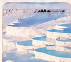
PAMUKKALE ปานุกคาล่า