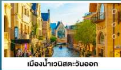
เมืองน้ำเวนิสตะวันออก