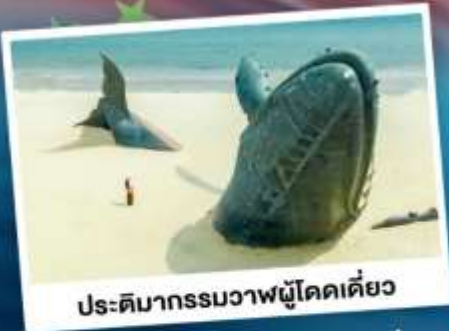
ประติมากรรมวาฬผู้โดดเดี่ยว