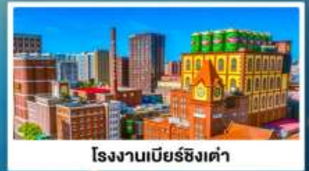
โรงงานเบียร์ซิงเต่า