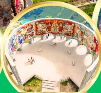
Russian-Georgian Friendship Monument