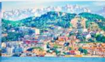
หมู่บ้านชาวประมงซาจื่อโข่ว