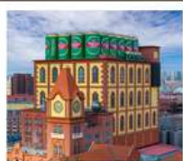
โรงเบียร์สิงคโปร์