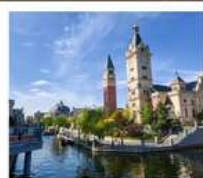
เมืองเวนิสแห่งต้าเหลียน