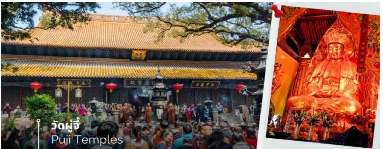
วัดผู้จี Puji Temples

หลังจากนั้นนำท่านนมัสการองค์พระโพธิสัตว์ เจ้าแม่กวนอิมไม่ยอมไป วัดไผ่สีม่วง อีกหนึ่งวัดที่ตั้งอยู่บนเกาะผู้โถวซาน ซึ่งที่นี่ได้รับสมญานามว่า “เกาะพระโพธิสัตว์” เพราะเป็นวัดเล็กๆ ที่อยู่ติดกับทะเล สาเหตุที่เรียกว่าวัดไผ่ม่วงเพราะว่าบริเวณนั้นมีต้นไผ่สีม่วงขึ้นเยอะ และความพิเศษอีกอย่างหนึ่งคือ ต้นไผ่สีม่วงจะมีในเกาะแห่งนี้ที่เดียว สำหรับไฮไลต์เด็ดของที่นี่คือ “เจ้าแม่กวนอิมไม่ยอมไป” ซึ่งวัดนี้มีประวัติมาอย่างยาวนาน ตั้งแต่สมัยราชวงศ์ถัง (ค.ศ. 961) ซึ่งเป็นยุคที่