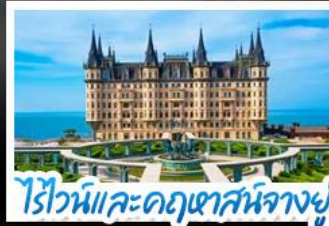
ไร่ไวน์และคฤหาสน์นางยู