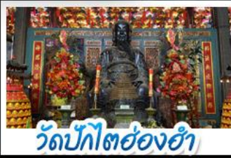
วัดปักไต้ฮ่องกง