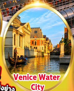
Venice Water City