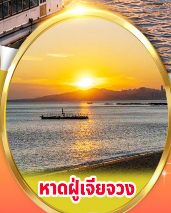
หาดผู้เจียวจง