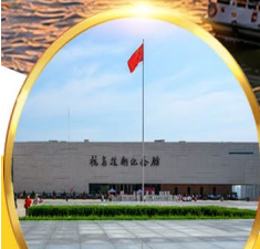
พิพิธภัณฑ์สงคราม เกาหลีตานตง