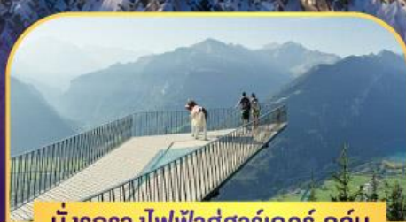
นั่งรถรางไฟฟ้าสู่ชาร์เตอร์ดูล์ม