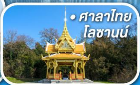
• ศาลาไทย โลซานน์