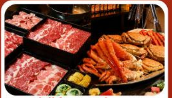
บุฟเฟ่ต์ซาบู ซาปู 3 ชนิด