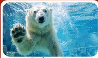
สวนสัตว์อาซาฮิยามะ