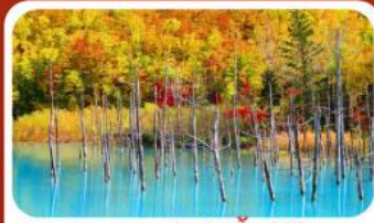
บลูพอนด์ (บ่อน้ำสีฟ้า)