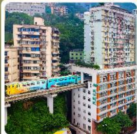
รถไฟกะลุดี้ก