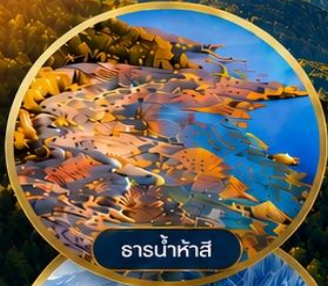
ธารน้ำห้ำสี่