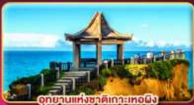
อุทยานแห่งชาติเกาะทองผิ้ว

ชมเทศกาลข้ามปีฉลองเทศกาลปีใหม่ 2027 แช่น้ำแร่ส่วนตัวในห้องพัก