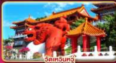
วัดหัวหน่วง