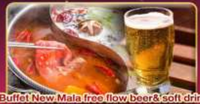
*Buffet New Mala free flow beer & soft drink