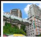
รถไฟกะลุดีทิก

ภูเขาควงอู๋ซาน (รวมกระเช้า) • อุทยานหมีขางซาน หินแกะสลักหนานคาน • ชมรถไฟกะลุดีทิก หงหยาดัง • ถนนคนเดินเจี๋ยฟางเป่ย์