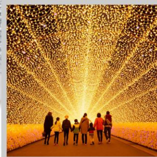
“NABANA NO SATO”