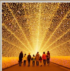
"NABANA NO SATO"