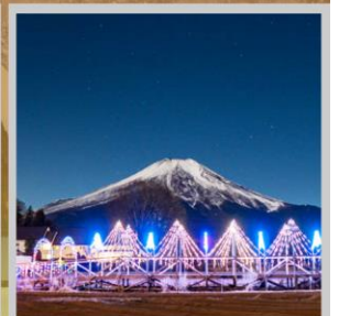
"YAMANAKAKO ILLUMINATION FANTASEUM"