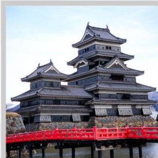
“MATSUMOTO CASTLE PARK”

สัมผัสความงดงามด้านนอก “ปราสาทมัตสึโมโตะ” ที่ตั้งตระหง่านท่ามกลางฉากหลังของเทือกเขาแอลป์ตอนเหนือ เปลี่ยนอิริยาบถ “ส่องเรือชมหุบเขาอะนะเคียว” ชมความงดงามธรรมชาติ ต้นไม้ หน้าผา และสะพานแดงอันโด่งดัง ตื่นตากับการประดับไฟกว่า 5 แสนดวง กับงาน “YAMANAKAKO ILLUMINATION FANTASEUM” ริมทะเลสาบยามานากะ สนุกสนานกับการเล่นหิมะ ในกิจกรรมต่างๆ ณ “FUJITEN SNOW PARK” พร้อมวิวภูเขาไฟฟูจิเป็นฉากหลัง ตระการตา “เทศกาลประดับไฟฤดูหนาว” ในธีมต่างๆหลากหลายโซน จัดแสดงไฟกว่า 2 ล้านดวงที่ยิ่งใหญ่ติดอันดับ1 ของญี่ปุ่น เปลี่ยนอิริยาบถ “นั่งกระเช้าฮาคุบะ อิวะตะกะะ” เพื่อชมวิวเทือกเขาแอลป์ญี่ปุ่นกับทิวทัศน์ฤดูหนาวแบบพาโนรามา