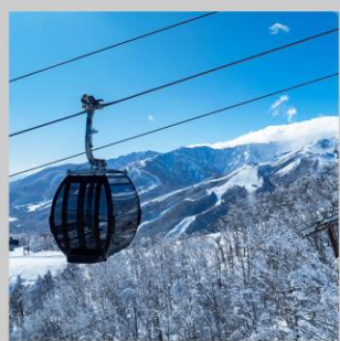
“HAKUBA IWATAKE GONDOLA”