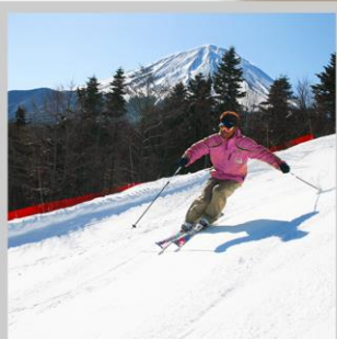
“FUJITEN SNOW PARK”