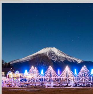
“YAMANAKAKO ILLUMINATION FANTASEUM”