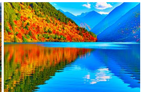
ทะเลสาบแพนด้า