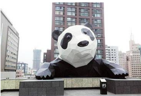
หมีแพนด้าปีนตึก IFS