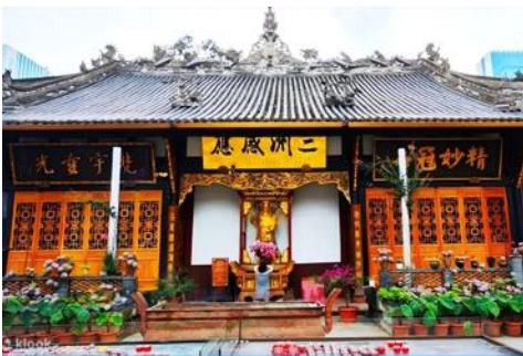
ถนนไท่กุ่หลี่ และวัดต้าเจี๋ย