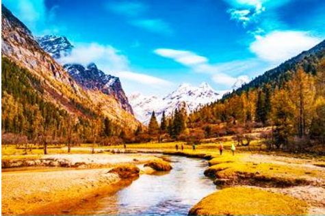
อุทยานภูเขาสี่ครุณี

รับประทานอาหารเช้า ณ ห้องอาหารของโรงแรม (2)