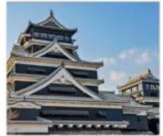
ปราสาทคามาโมตะ