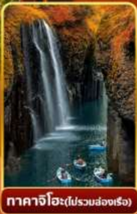
ทาคาจิโอะ (ไม่รวมสกีเรือ)