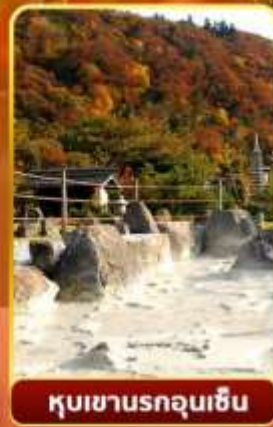
หุบเขานรกอุเนเซน

🌿 ออนเซ็น 2 คืน 🧳 นน.กระบี่ 1 ไร่ 23 กก 🌞 7Days 5Night