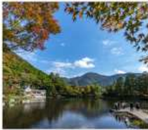
ยูฟูอิน(ทะเลสาบคิริน)