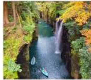
หุบเขาทาดาจิโฮะ