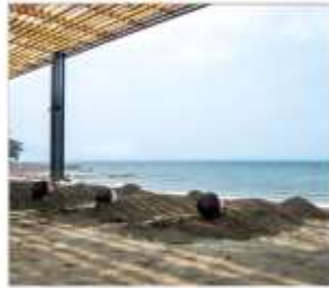
อามทรายร้อย