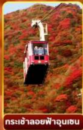
กระเช้าลอยฟ้าอุเนเซน