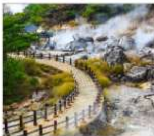
หุบเขานรกอุเซ็น