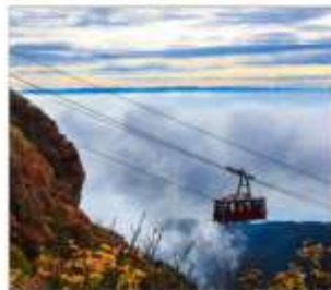
นั่งกระเช้าลอยฟ้าอุเซ็น