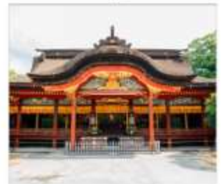
ศาลเจ้าดาไซฟู