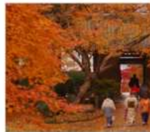
วัดไดโตะเซนจิ