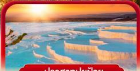
ปราสาทปูยฝ้าย