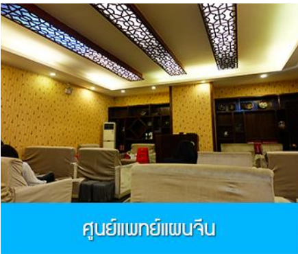
ศูนย์สปาหยีแพนจิน

พักที่ HANTING HOTEL ระดับ 4 ดาวท้องถิ่นหรือเทียบเท่าในเมืองจางเจียเจี๋ย