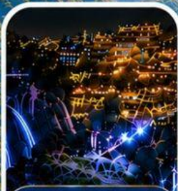
เมืองโบราณผุ่รงเจิน หมู่บ้านโบราณกลางหุบเขา