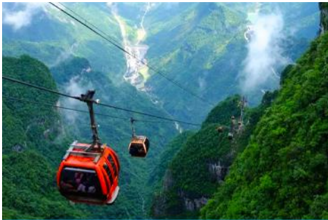
เขาเจ็ดดาว

เที่ยง รับประทานอาหารกลางวัน ณ ภัตตาคาร **บุฟเฟ่ต์หมูย่างเกาหลี (8)