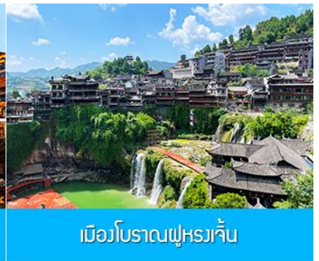
เมืองโบราณฝูหยงจิน