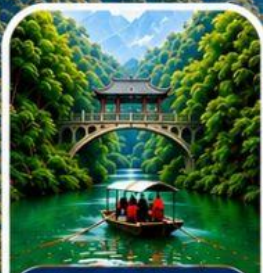
ลำธารหลงจินซี ชมธรรมชาติสุดอลังการ

ชมความงามมุมพิเศษ มุมพีคที่สุดแห่งเกาะหลีสุตพิ่น