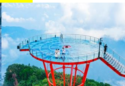
ระเบียงชมวิว Sky Eye