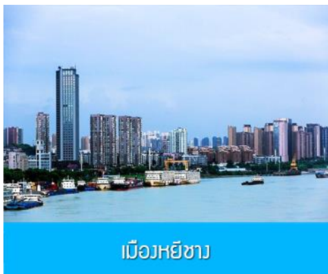
เมืองหยี่ชาง