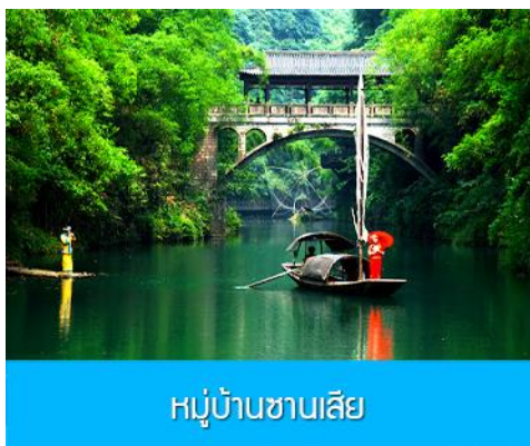
หมู่บ้านซานเสี๋ย

พักที่ YICHANG HUIHAO HOTEL โรงแรมระดับ 4 ดาวหรือเทียบเท่าในเมืองหยี่ชาง