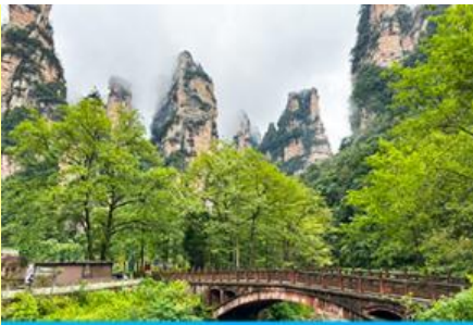
จุดชมวิวจิมเปียนซี