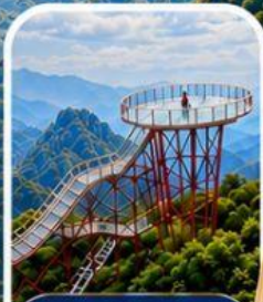
เขาเจ็ดดาว จุดชมวิวสุดหวาดเสียว