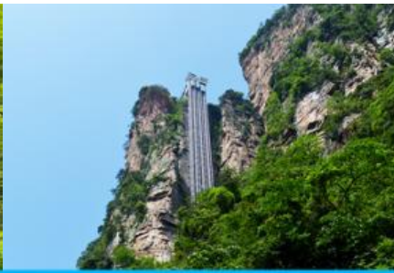
ลิฟท์แก้วไปหลม