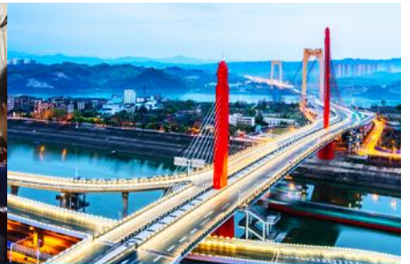
เมืองหยีซาง

วันที่ห้า เมืองจางเจี๋ย- เลือกซื้อโปรแกรมทัวร์เสริม OPTIONAL TOUR - ร้านหยก-ร้านใบชา-เมืองหยีซาง