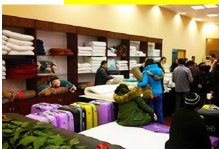
ศูนย์จำหน่ายผลิตภัณฑ์ยวพารา