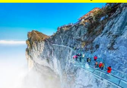
ระเบียงทางเดินกระจกเลียหน้าผา