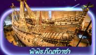
พิพิธภัณฑ์ทิวาซา